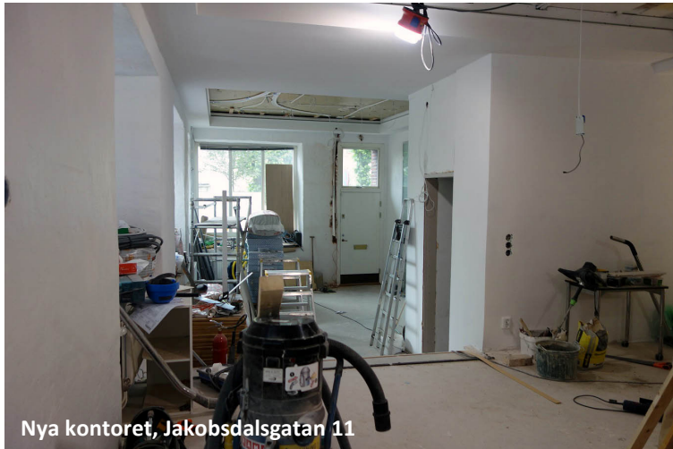
Nya kontoret, Jakobsdalsgatan 11