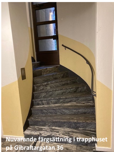
Nuvarande färgsättning i trapphuset på Gibraltargatan 36