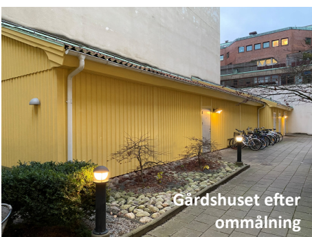
Gårdshuset efter ommålning