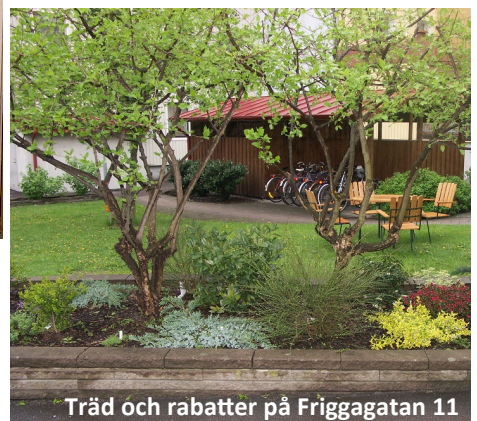
Träd och rabatter på Friggagatan 11

Med fokus på att bevara trädens lummighet ser vi över hur belysningen bättre kan harmoniera med träden. I samband med detta planerar vi att modernisera stödmurarna kring rabatterna och reparera delar av asfaltsytorna.