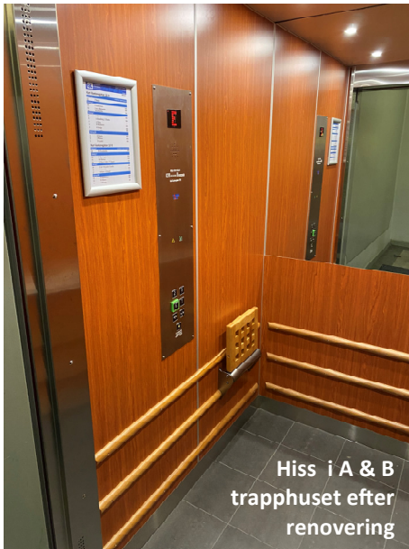
Hiss i A & B trapphuset efter renovering

Under hösten renoverades hissarna på Karl Gustavsgatan 10. Arbetet utfördes av Vinga Hiss.