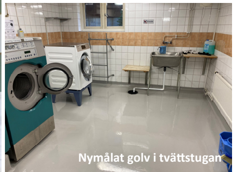
Nymålat golv i tvättstugan

För ett par år sedan renoverades torkrummen till de båda tvättstugorna och nu var det dags för golven i just tvättstugorna att få nytt liv. Golven har målats ljusgrå för en mer tidsenlig look. Efter jul- & nyårshelgen kommer även taken i tvättstugorna att målas.