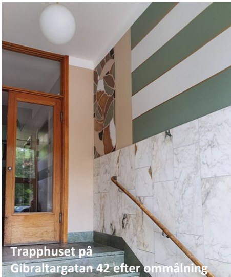
Trapphuset på Gibraltargatan 42 efter ommålning

Linnémålarna är specialiserade inom dekorativt måleri, restaurering, design och färgsättning. Vi ser med glädje fram emot att få ta del av deras förslag på hur trapphuset på Gibraltargatan 36 kan komma att se ut.