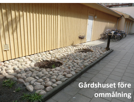
Gårdshuset före ommålning

Huset var redan sedan tidigare gult men färgen hade med tiden bleknat. Med nya fönster samt nyrenoverad fasad stod det klart att även gårdshuset behövde en uppfräschning.